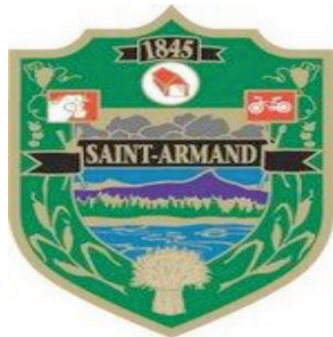
Municipalité de Saint-Armand