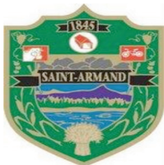
Municipalité de Saint-Armand